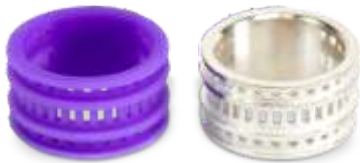
Voskový výtisk (fialový), zbavený podpor a následně odlitý v požadovaném kovu (stříbrný) ve vysoké přesnosti a detailu.